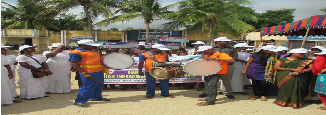
Rally with Sword Adhiyaman Kalai Kuzhu

GOI, Field Publicity Department and DDHS, SWORD Jointly organised Health awareness Rally and Awareness street Play programmes and Medical Camp at Pothinayanapalli 13.08.15 in Krishnagiri District.