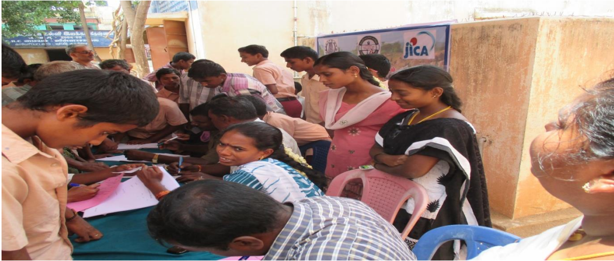
TWAD Board Hogenakkal Water Supply and Flourosis Mitigation Project and SWORD NGO Jointly Organised special medical camp at PUPS Nagarasampatti in krishnagiri District on 01.08.2015.