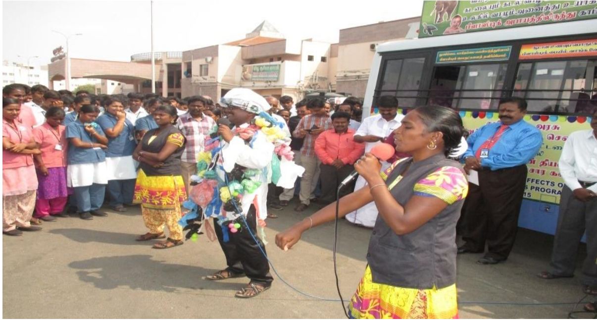
Programmes jointly organized with Nehru Yua Kendra, Arumbugal arakkattalai tirunelveli, TN Pollution board and SWORD.(8.4.15) 1.Boganapalli 2.kaattinayanapalli 3.Kammampalli 4.Mallinayanapalli 5.Megalachinnampalli 6.Magarajakadai 7.BC.PUDHUR 8.B.G.pudhur.