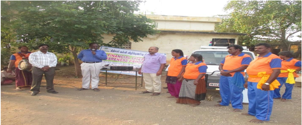
GHS SCHOOL, GERIKEPALLI UTHANGARAI BLOCK H.MS SPEECH . 27.01.2016 TO 11.02.16(12 DAYS)