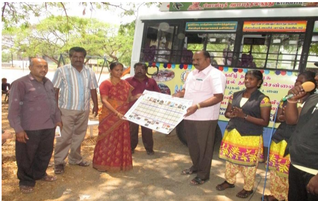
6.PUPS thalalpalli 7.Anna college 8.Bargur.