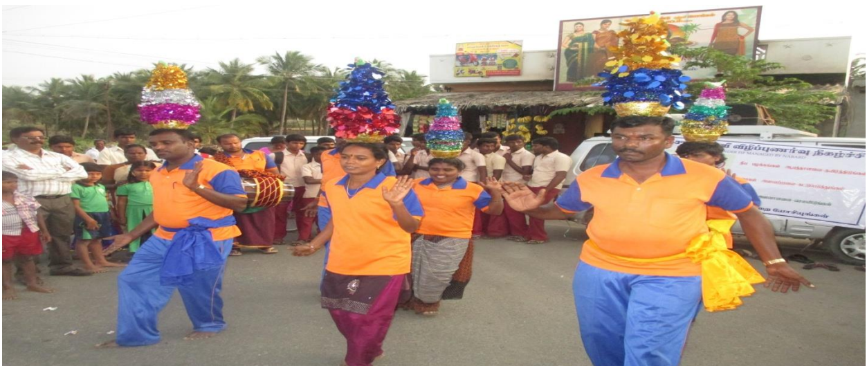
OUR TEAMS KARAGATTAM PERFORMING.