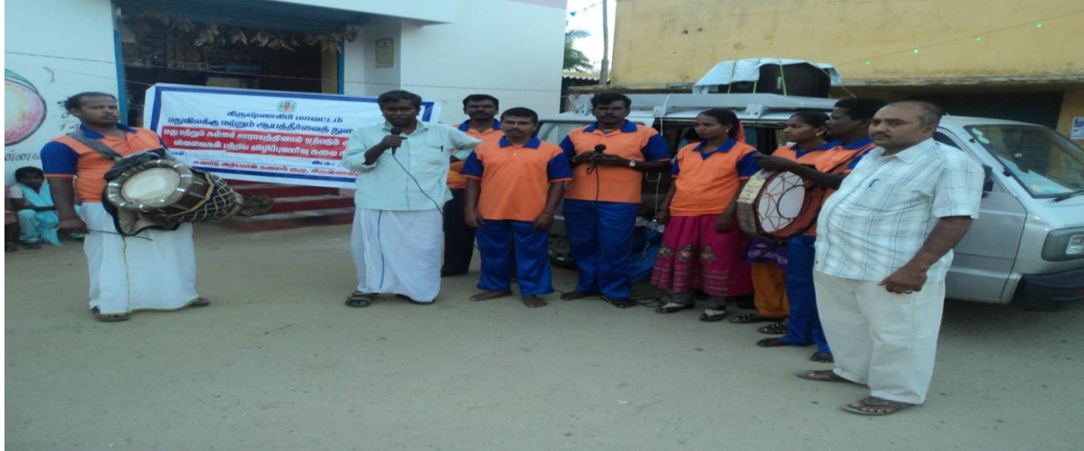
Child labour awareness street plays 8 days programmes conducting in krishnagiri district through our sword adhiyaman kalai kuzu.