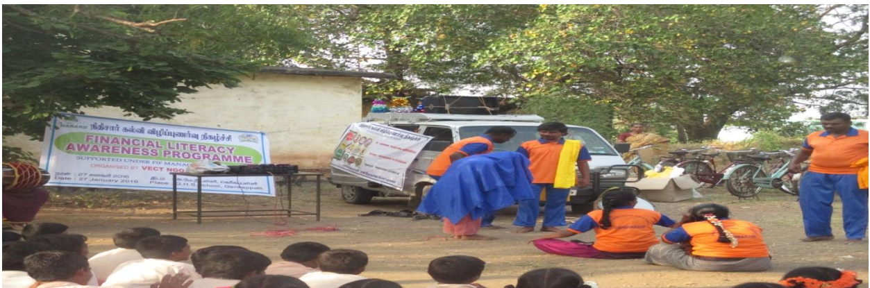
STREET PLAY PERFORMING