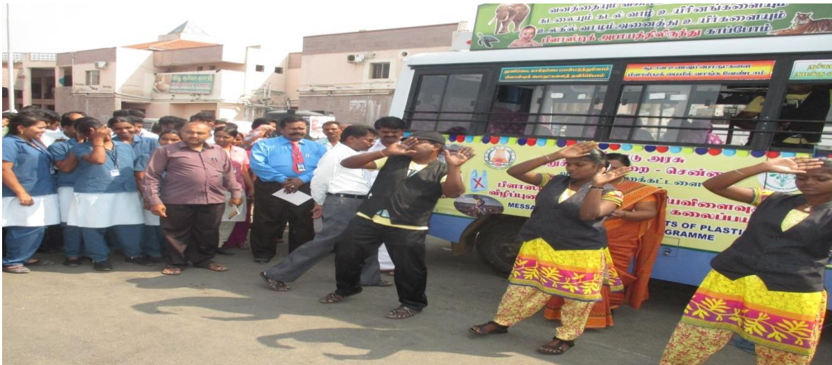
Pollution awareness programmes conducting in krishnagiri district of 20 villages about plastic usages and costs. 7.4.15 1.New bus stand 2. Old bus stand 3.Govt Arts college womens 4. PUPS Kattiganapalli 5. GHS Kattiganapalli